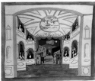
Pulcinella se estrenó en el Théâtre de l'Opéra de París el 15 de Mayo de 1920, bajo la batuta de Ernest Ansermet.