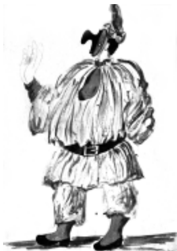
El diseño de vestuario y los decorados corrieron a cargo de Pablo Picasso

cipación de la tonalidad, y del impresionismo, nos trae una nueva "objetividad musical" que, desde su estilización, renuncia a los excesos psicológicos de finales del siglo XIX y nos lleva a una imagen cercana a la vida despreocupada, mecánica y artificial que domina los años posteriores a la Primera Guerra Mundial.