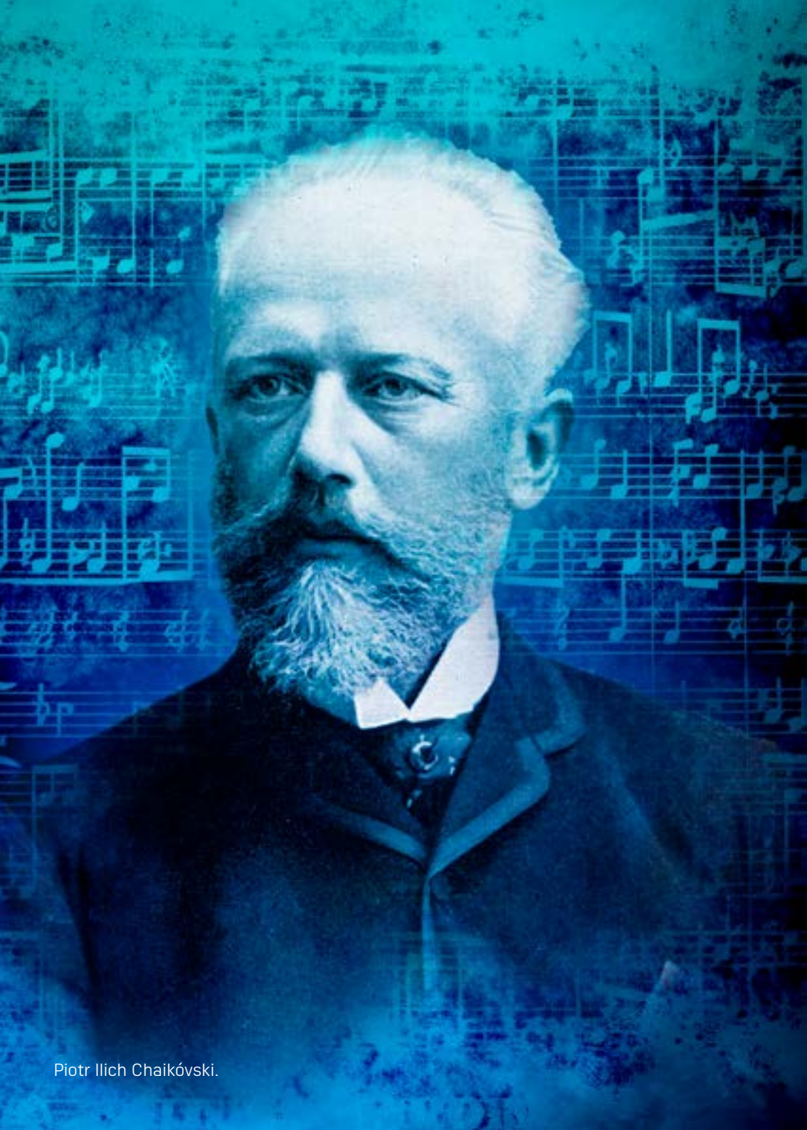
Piotr Ilich Chaikóvski.