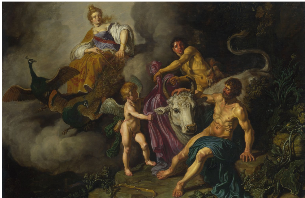
Juno descubriendo a Júpiter con Ío . Pieter Lastman (1618). National Gallery of London.

Las tres sinfonías con las que Mozart se despide se nos presentan (y suelen grabarse) como un ciclo y se escribieron en el venturoso verano de 1788 en su nueva casa de la periferia vienesa, al parecer destinadas a una serie de conciertos por suscripción que no se llevaron a cabo. Serenidad, intensidad, esplendor son los sustantivos que podrían aplicarse respectivamente a cada una de ellas.