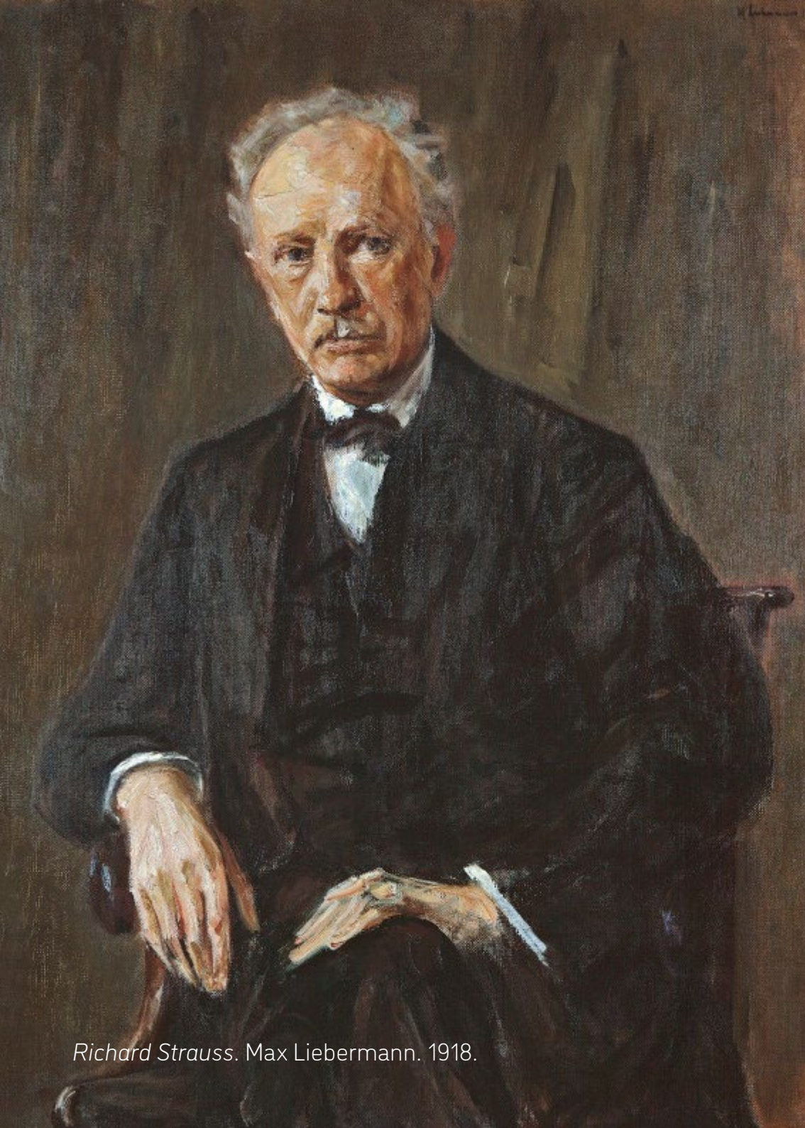
Richard Strauss. Max Liebermann. 1918.