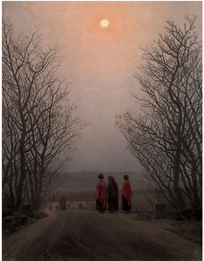
Mañana de Pascua. Caspar David Friedrich. Museo Thyssen-Bornemisza, Madrid, c. 1828-1835.

Y mañana el sol volverá a brillar; y por el camino que yo recorreré, nosotros nos reuniremos otra vez, los bienaventurados, en el seno de esta tierra que respira la luz del sol. Y a la inmensa playa, bañada por olas azules, bajaremos despacio y silenciosamente, calladamente nos miraremos a los ojos, y sobre nosotros descenderá el mudo silencio de la felicidad.