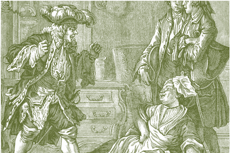
Detalle de grabado de Jean-Michel Moreau. Monsieur Jourdain y Nicolasa, de El burgués gentil hombre . Reproducción publicada antes de 1913 en Lavergne (París).

(Al Maestro de Música). Veamos vuestra obra.