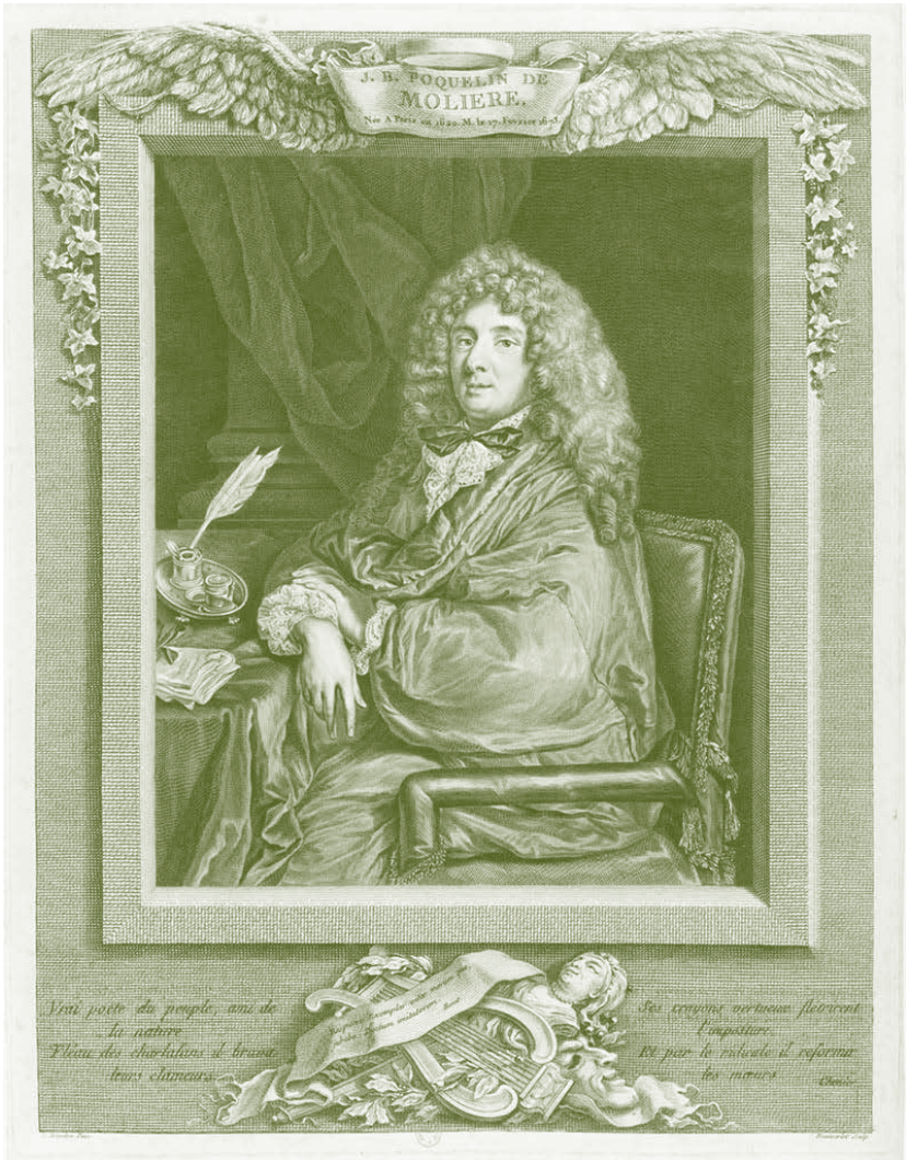
Jean-Baptiste Poquelin "Molière". Grabado del siglo XVIII de Jacques-Firmin Beauvarlet, inspirado en un retrato del siglo XVII de Sébastien Bourdon.