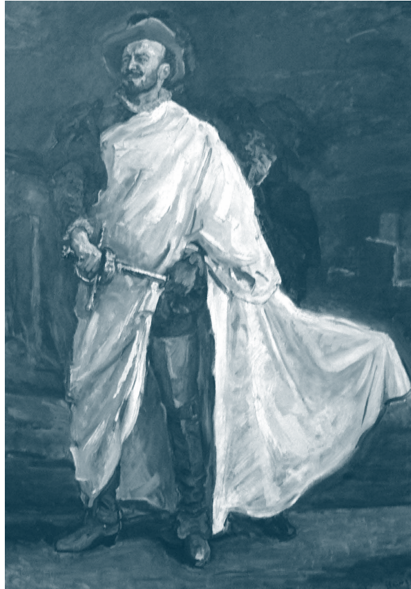
Don Juan desvainando la espada en Don Giovanni de Mozart; cuadro de Max Slevogt: Francisco d'Andrade como Don Giovanni, 1912.