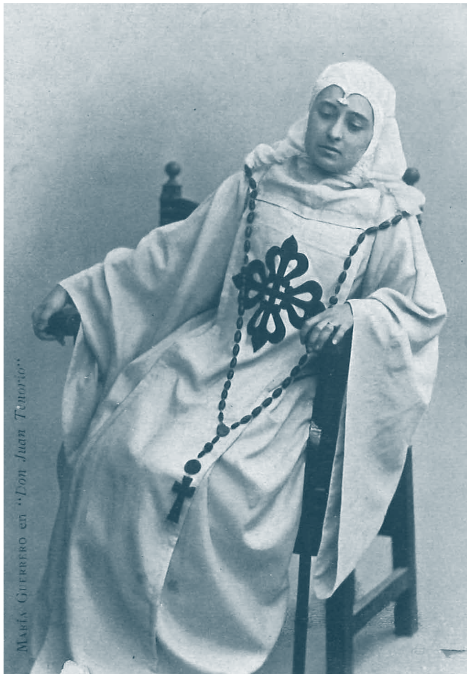
María Guerrero en "Don Juan Tenorio"