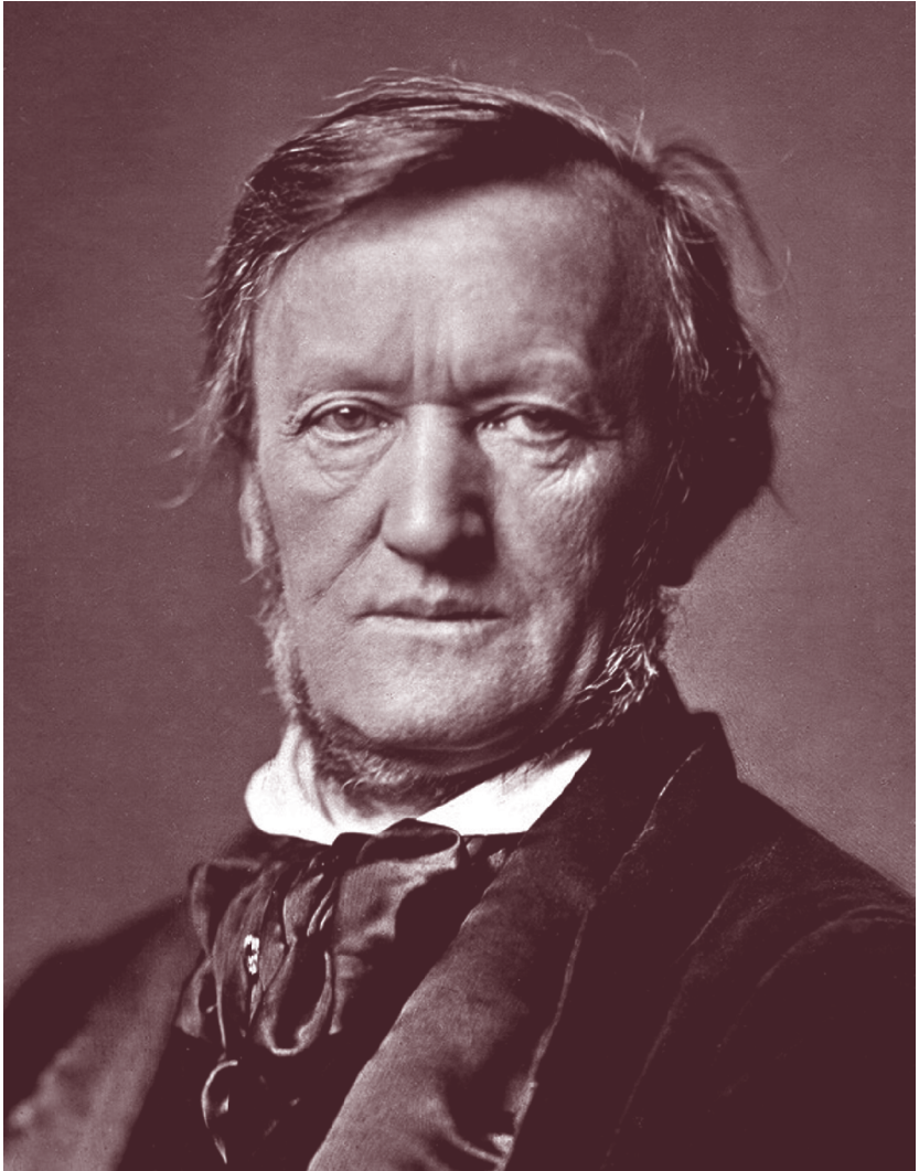
Wilhelm Richard Wagner. Retrato del compositor de Leipzig en su madurez creativa.